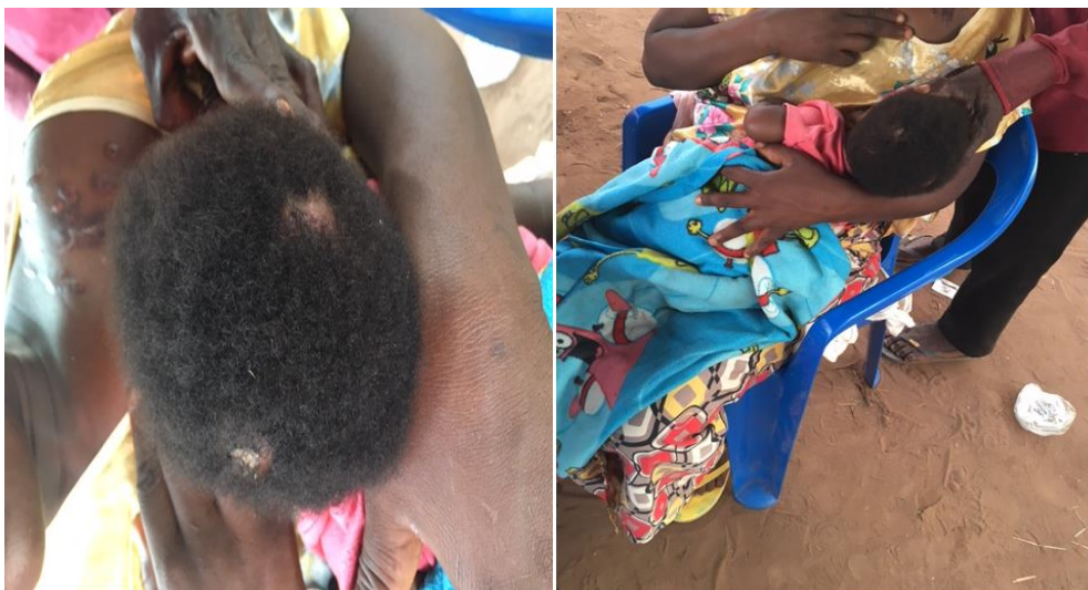
Bébé ayant reçu deux balles dans la tête quatre heures après sa naissance à la clinique du village de Cinq, le 24 avril 2017

41. Les Bana Mura ont également tué des habitants Luba et Lulua non armés dans les villages de Kasandje, Tschitundu, Mwakaanga et Kanpotopoto, utilisant des méthodes similaires. Le 15 avril, les Bana Mura auraient attaqué Kasandje où ils seraient ensuite restés pendant trois jours. Certains des habitants Tchokwe, Pende et Tetela se seraient joints à la milice pour éliminer la population Luba et Lulua. L'organisateur de l'attaque serait un leader local Pende de haut rang. Une femme interviewée par l'équipe du HCDH a déclaré avoir perdu huit membres de sa famille durant cette attaque. Elle a rapporté que lorsqu'elle était retournée au village après l'attaque pour les enterrer, elle avait vu de nombreux corps, dont certains étaient décapités ou coupés en morceaux. Des témoins ont fourni le nom de 10 victimes de meurtres à Kasandje, dont deux enfants.