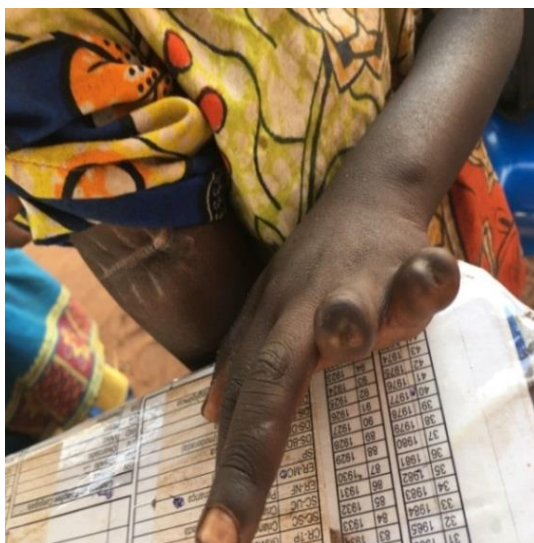
Un enfant du village de Cinq dont les doigts ont été coupés à la machete par un chef coutumier local, le 24 avril 2017 (Photo prise par le HCDH le 18 juin 2017)

45. L'équipe a interviewé une mère avec son fils de sept ans qui avait été pris par un chef traditionnel à Cinq alors qu'il tentait de s'échapper du village le 24 avril. Le chef local lui a coupé quelques doigts (voir photo ci-dessous) tandis que d'autres agresseurs lui ont ouvert le visage et le bras. Le garçon était totalement défiguré.