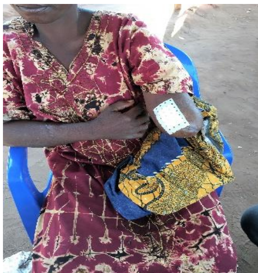
Une femme ayant survécu à l'attaque de Cinq par les Bana Mura le 24 avril. Après sa fuite de RDC un de ses bras a dû être amputé dans un hôpital angolais

47. Une autre patiente interviewée par le HCDH a signalé : « les Bana Mura ont fait irruption à mon domicile de Cinq et tué mon mari. J'a reçu une balle dans la jambe alors que mon fils âgé d'un an et 10 mois a reçu une balle dans la jambe gauche, et ma fille a été frappée à la machette sur le dos » (voir photos ci-dessous). La victime a signalé qu'elle avait marché pendant une semaine pour atteindre la frontière, d'où elle a été transportée par hélicoptère à l'hôpital de Dundo en Angola. En raison de ses blessures, son fils a dû être amputé d'une jambe à l'hôpital (voir photo ci-dessous).